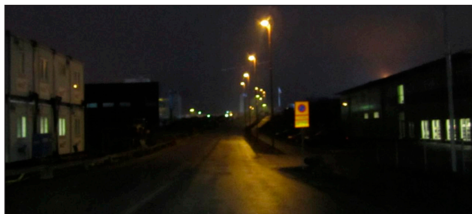
Innan åtgärd: Högtrycksnatriumlampornas gulaktiga ljus betjänar bara halva vägbanan, om ens det.

Vägen var i behov av ny belysning eftersom den befintliga belysningen var av ålderstigen urladdningsteknik. Högtrycksnatriumlampornas gula ljus gjorde att vägen kändes skum trots att den kantas av stora logistikaktörer. Man efterfrågade från hamnens sida en mer energieffektiv lösning som gav bättre och jämnare ljus.